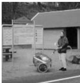
Beginn des Milseburg-Radweges in Hilders/Rhön

Auf zwei weitere Radtouren möchten wir aufmerksam machen, für die eine Anmeldung rechtzeitig erfolgen sollte: