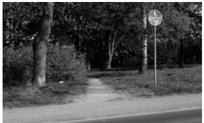
Am Erlenborn: Beginn in unübersichtlicher Kurve, hohe Bordsteinkante...

das vom Planungsverband Ballungsraum Frankfurt/Rhein-Main angestrebte regionale Radroutennetz gibt, sollte es nicht an Schwalbachs Stadtgrenzen enden. Also besteht die Hoffnung, dass dann wirklich einmal spürbar positive Ergebnisse für die Radfahrer realisiert werden könnten. Allzu viel muss ja bei uns gar nicht getan werden, wenn auf den Straßen, die keine Verbindungsstraßen zu den Nachbarorten sind, die Geschwindigkeit auf 30 km/h reduziert wird, Einbahnstraßen geöffnet und Bordsteinkanten abgesenkt werden.