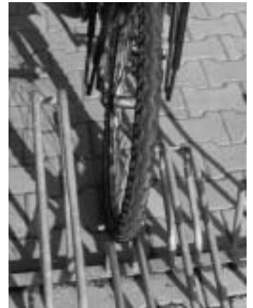
Tja, und dann passt's nicht mal, der 50er-Schlappen ist zu breit

Nun, mein lieber Herr Damsch, das ist sicherlich Ihre private Entscheidung, ob Sie überhaupt mit einem Fahrrad zum Einkauf fahren und wenn ja, dann mit welchem.