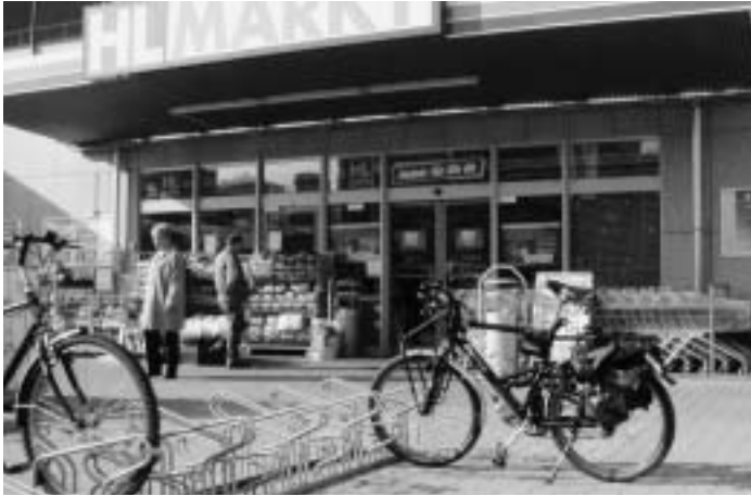
HL-Markt in Niederrad, Goldsteinstraße

Von einer, die auszog und wagte, mal nach besseren Fahrradabstellanlagen zu fragen