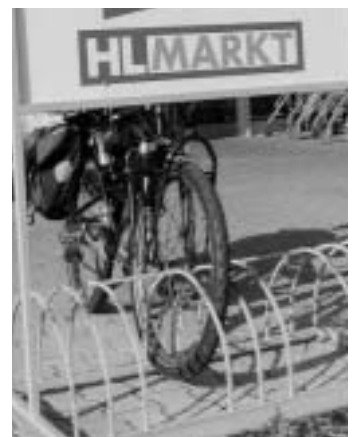
Die Alternative, auch nicht besser – wo anschließen?

Nur habe ich mir mein bequemes Leib- und Magenfahrrad für alle Alltagszwecke nicht zugelegt, um dann aus Angst vor einem möglichen Diebstahl mit einer alten Rostgurke zum Supermarkt zu schradeln. Ob Sie mit Ihrer obrigkeitstaatlichen Art (ich fühlte mich fast wie eine Bittstellerin beim Ordnungsamt) der Kundschaft gegenüber etwas für Ihren Arbeitgeber gut gemacht haben, kann Ihnen auch egal sein. Schließlich ist Kundenkontakt und Service nicht Ihre Tätigkeit, und die Wettbewerber bieten ja bei den „Fahrradständern“ das gleiche Bild des Jammers – also habe ich zu meinem Bedauern keine Vorteile davon, dorthin zu wechseln und Rewe zu meiden. Nur weiß ich zukünftig ein wenig genauer, was ich von der Kundenorientierung eines Konzerns zu halten habe, der zwar regelmäßig zum Frühjahr buntes Fahrradzubehör und billige Trekkingräder anbietet, der radelnden Kundschaft aber ansonsten die kalte Schulter zeigt.