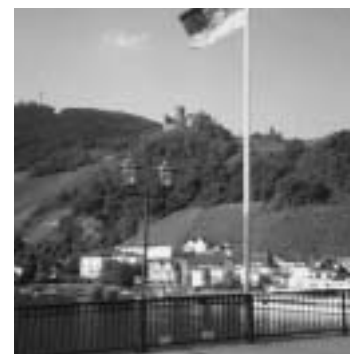
Blick von der Moselbrücke auf die Burg

Wir wollen radfahren, wandern und schwimmen. Radfahren kann