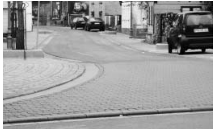
Fahrradunfreundlich und gefährlich: Zufahrt Altstadt