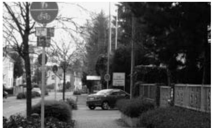
Behinderung auf benutzungspflichtigem Radweg Sulzbacher Straße: Grünanlagen, ausgewiesene Parkplätze und Bushaltestellen